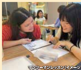
マンツーマンレッスン(イメージ)

マンツーマンでは英語の基礎となる文法、文章構成を学習し、さらにライティング、リーディング、リスニング、スピーキングの4技能を向上させるプログラムになっています。グループ授業では英語で自分の意見を述べることに重点が置かれ構成されています。